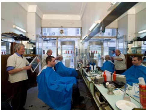
Barbearia Moderna Lda Rua D.Antão de Almada 4 H

Mesmo ao lado da Igreja de S.Domingos, com 4 cadeiras, são dois os barbeiros, sócios e colegas desde sempre. O mobiliário e decoração já muito usados, é bem ao estilo da época da sua abertura, 1952.